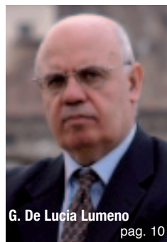
G. De Lucia Lumeno pag. 10